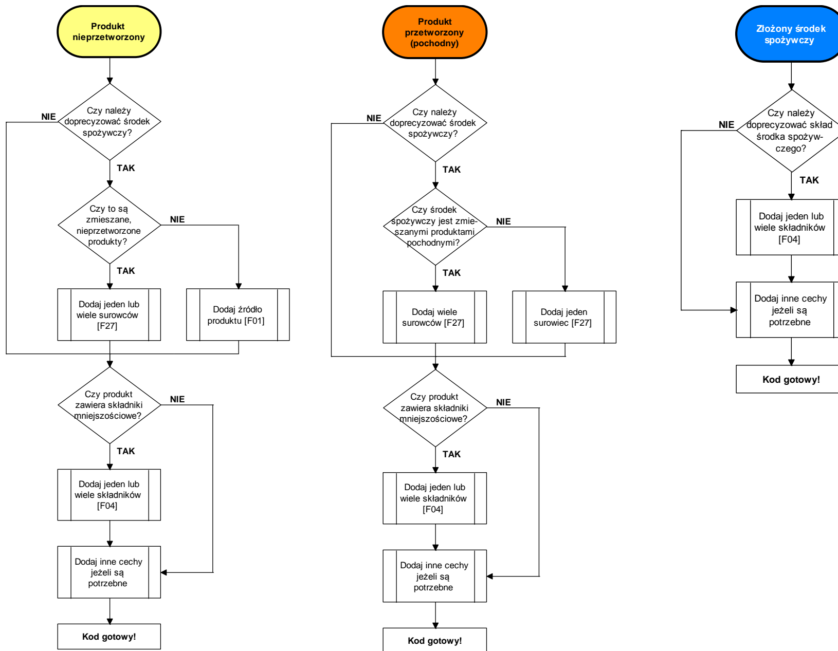
Schemat 2. Dobór składników lub surowców w zależności od rodzaju środka spożywczego